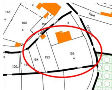
Zonage après révision

L'ancien zonage n'incluait pas le jardin de la maison et ne lui permettait donc aucune extension. Toutefois, force est de constater que le jardin est déjà occupé par une piscine. La rectification vient donc mettre le zonage avec la réalité de l'occupation du sol, à savoir que le terrain concerné n'avait pas de destination agricole particulière, sur une surface de 1822m 2 .