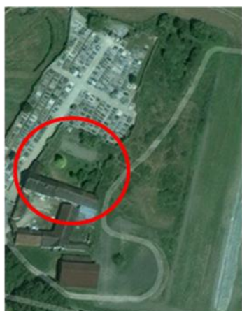
Vue sur la parcelle concernée