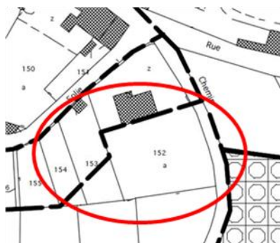
Zonage avant révision