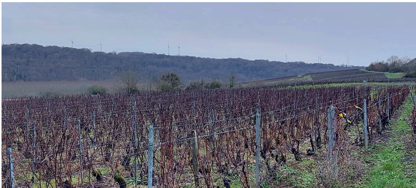
— Charleville 2.jpg —