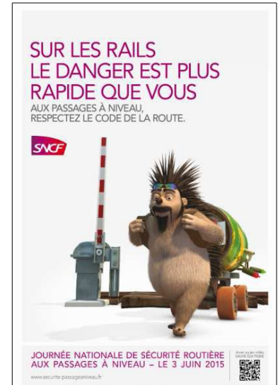
Figure 2 : Affiche de SNCF Réseau à l'occasion de la journée nationale de sécurité routière aux passages à niveau du 03/06/2015

Enfin vous pouvez vous associer à la journée annuelle nationale de sensibilisation à la sécurité des passages à niveau.