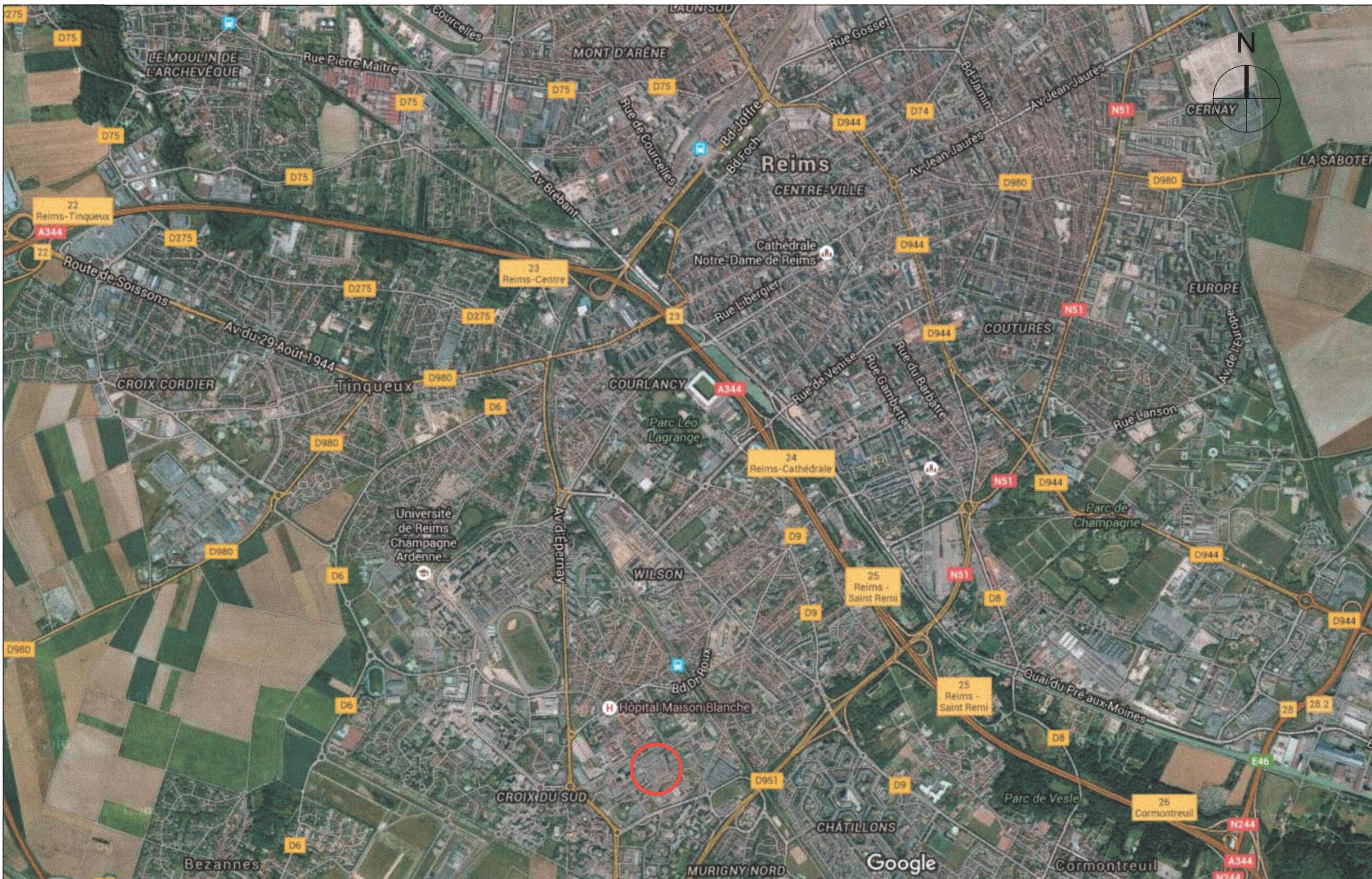
PLAN DE SITUATION SUR LA VILLE DE REIMS