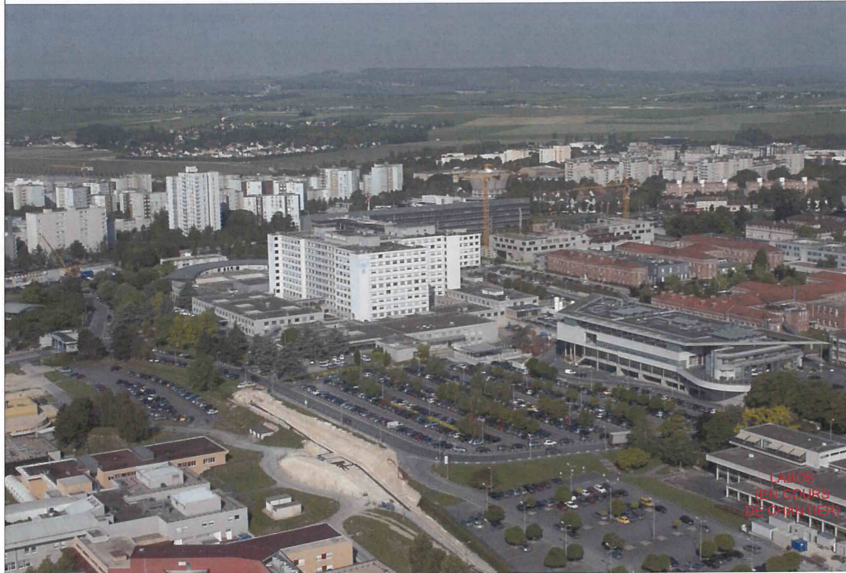
VUE LOINTAINE ANGLE EST