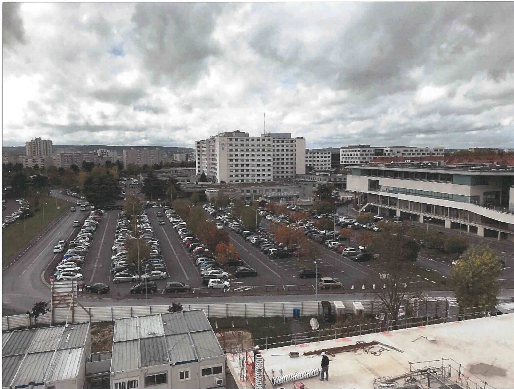
VUE PROCHE ANGLE EST/NORD-EST