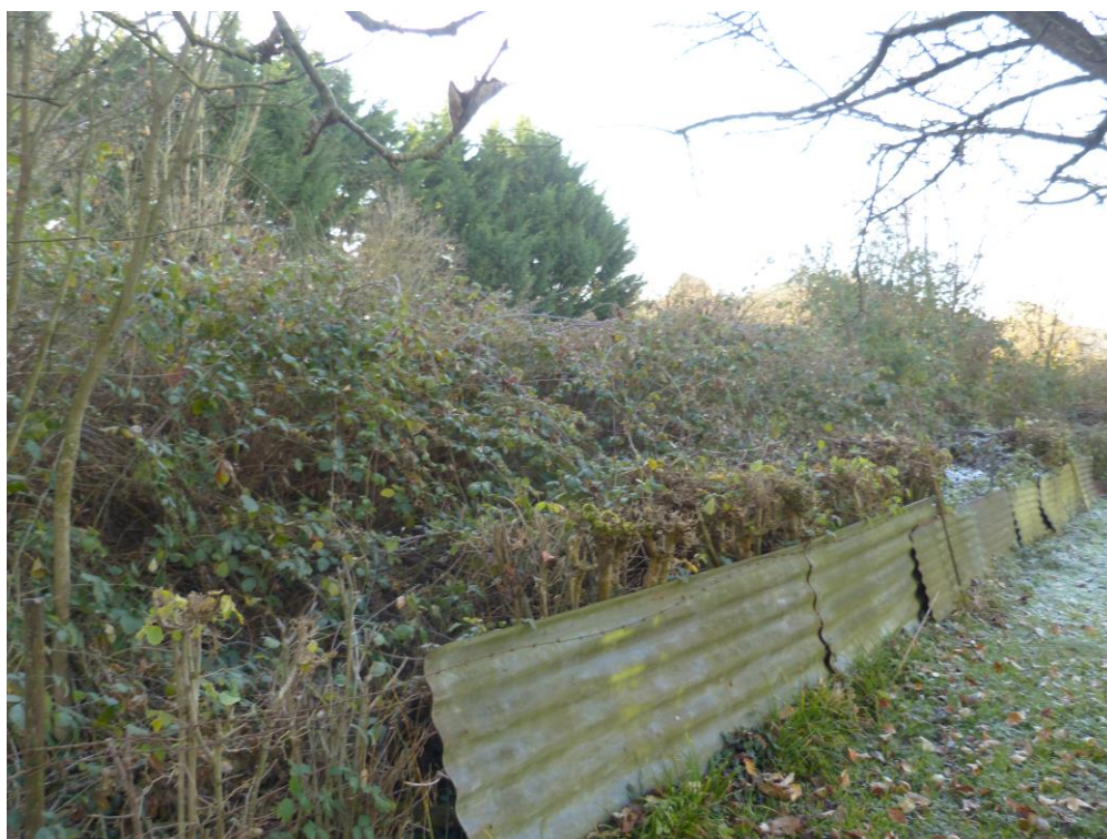
Figure 3 : illustration de la parcelle 239.

La parcelle correspond à une végétation de friche dominée par des ronciers. La saison automnale/hivernale étant bien avancée, l'inventaire n'a pu être exhaustif. Toutefois, aucune espèce de zones humides n'a été recensée.