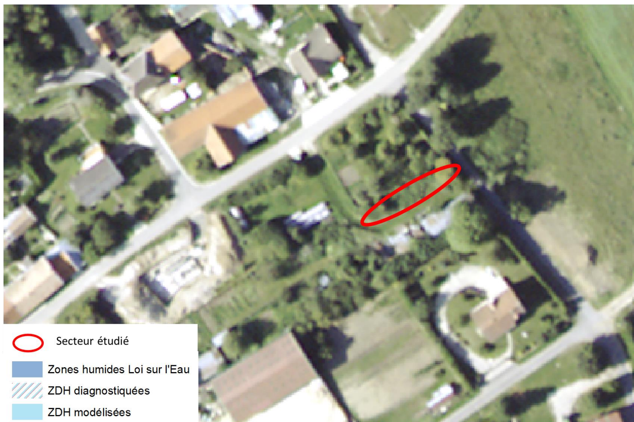
Figure 1 : Localisation du secteur étudié.