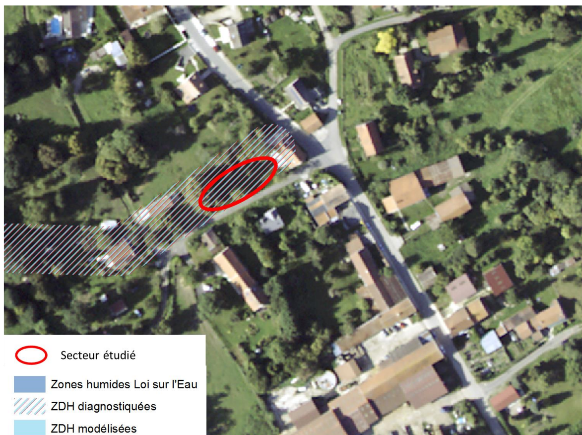
Figure 1 : Localisation du secteur étudié.