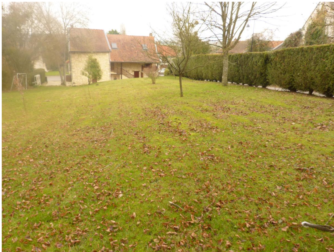
Figure 3 : illustrations de la parcelle 43.

La saison automnale/hivernale étant bien avancée, l'inventaire n'a pu être exhaustif. Toutefois, aucune espèce de zones humides n'a été recensée.