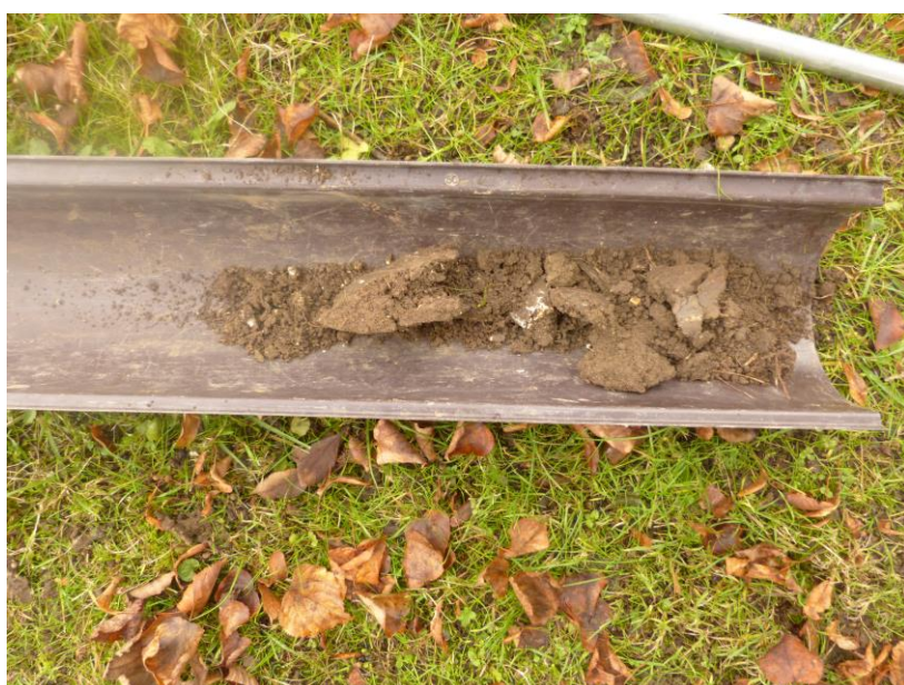
Figure 5 : profil de sol du sondage 1.