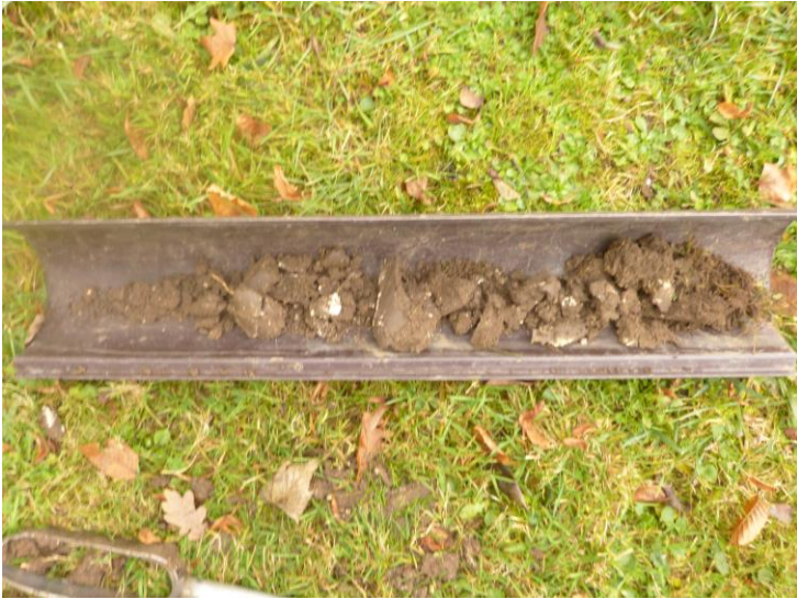
Figure 6 : profil de sol du sondage 2.

La profondeur des sondages pédologiques réalisés a atteint 50 centimètres. L'expertise rend compte de l'absence totale de traces d'hydromorphie. Aucun sol de zone humide n'a été rencontré.