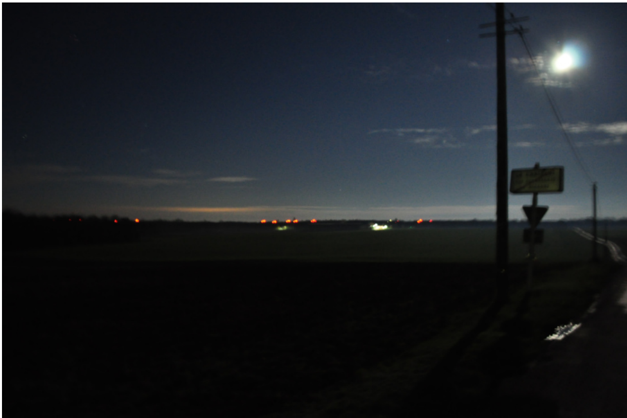
Vu du Châtelot éoliennes à deux fois la distance du parc de la Grande Contrée derrière la forêt du Gault et derrière Charleville