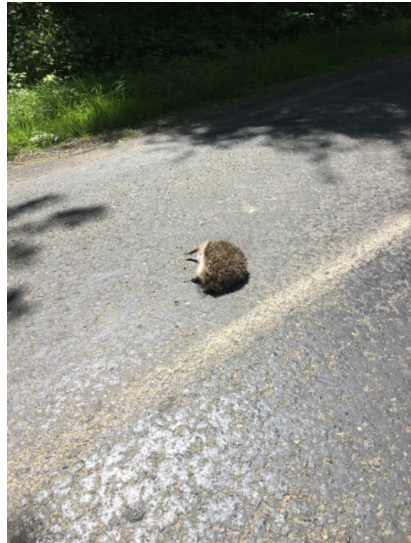
Hérisson route du Châtelot à L'Hermite