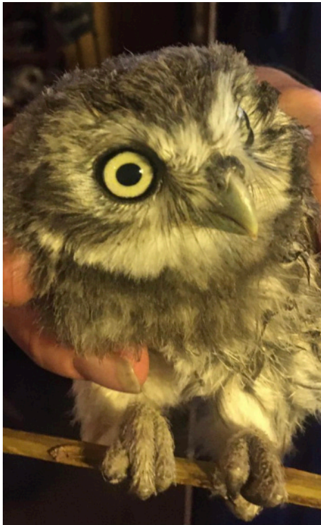
Chevêche d'Athena Châtelot

Avec ce parc on cumulera donc 5 icpe, avec celui des griottes, ce sera donc un total de 6 ICPE en lisière de la forêt domaniale du Gault ( forêt primitive) SANS AUCUNE ÉTUDE biologique sérieuse.