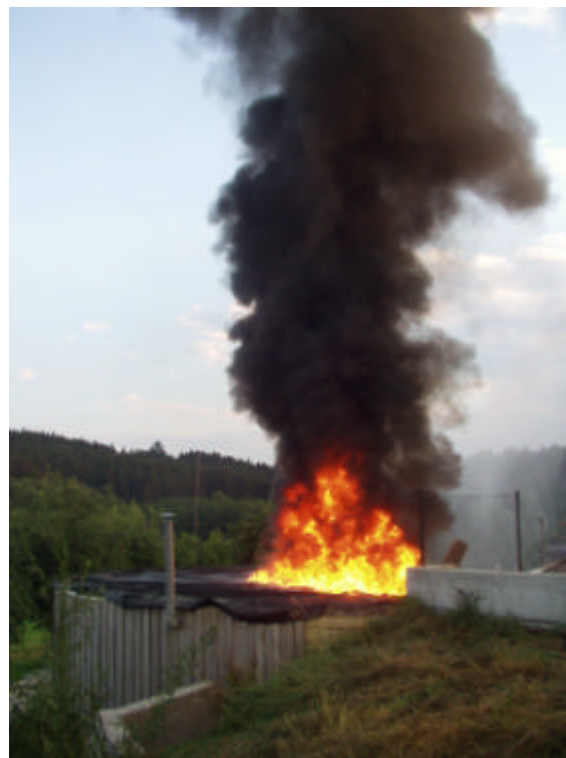
Image 15 + 16: le biogaz existant s'est complètement consumé, le feu s'attaque à l'isolation de la couverture