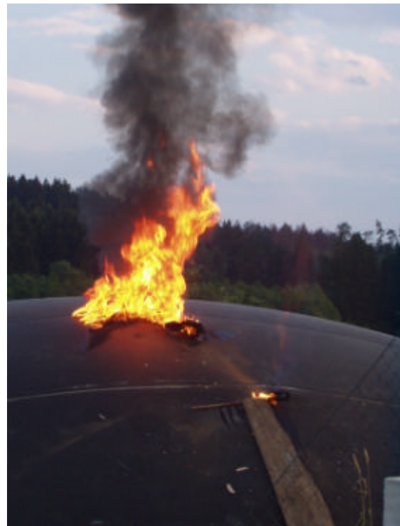
Image 10 + 11: 6. Un chiffon imbibé d'essence, enflammé, est jeté sur la membrane de stockage