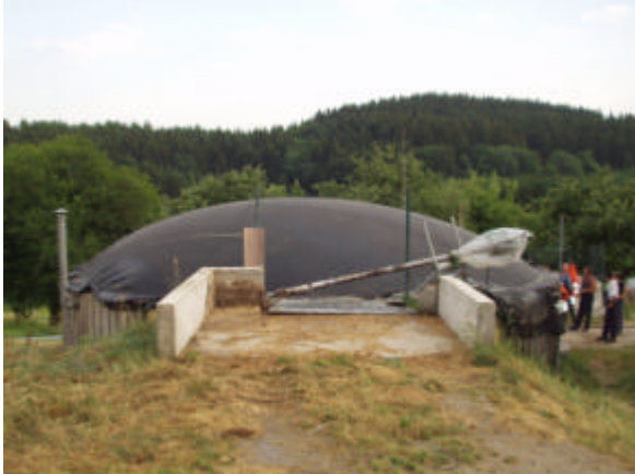
Image 1: Digesteur équipé d'un stockage souple (membrane EPDM) avant la test au feu.

Avant les tests au feu, les mesures de sécurité, les systèmes de suppression et la procédure ont été approuvées par les pompiers locaux. Ensuite, une zone de protection a été définie et le bâtiment voisin a été protégé par une paroi d'eau.