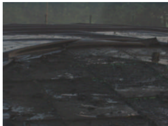
Image 18: Les pompiers interviennent Image 19: la membrane et l'isolation de la couverture brûlée.

Après 10 minutes, les pompiers ont éteint les derniers foyers de combustion. Les restes de la membrane brûlée ont été enlevés et on pouvait constater que l'isolation a été endommagée localement au niveau du foyer de la combustion.