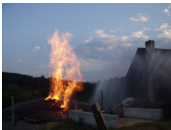
Image 12 + 13: 6. L'essence brûle, le gaz fuit et s'enflamme à son tour