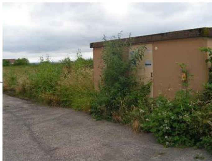
Photographie d'un trois convertisseurs