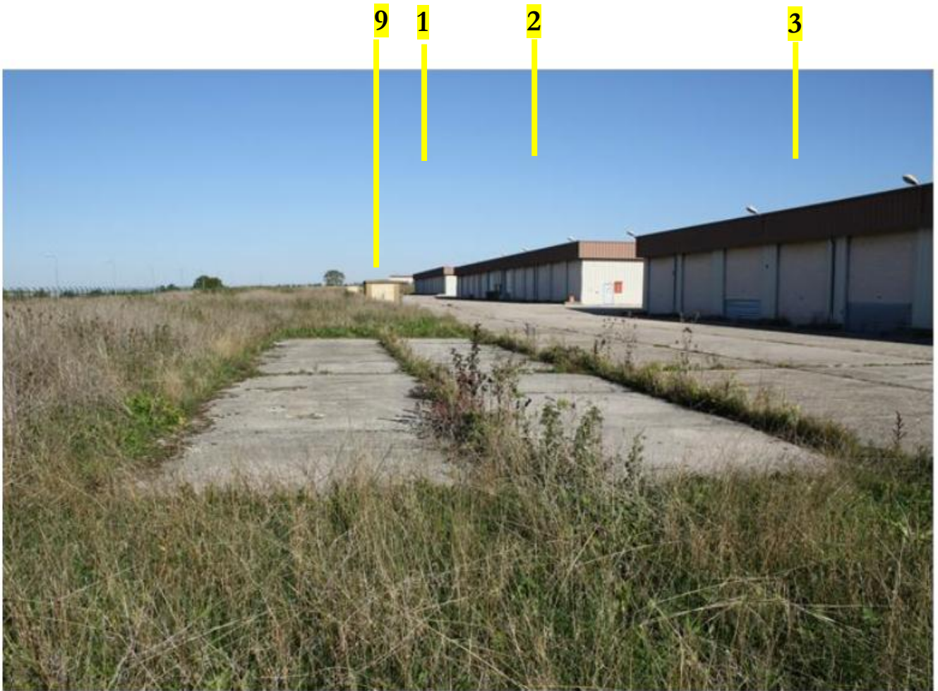
Photographie des garages situés à l'est du site et d'un convertisseur