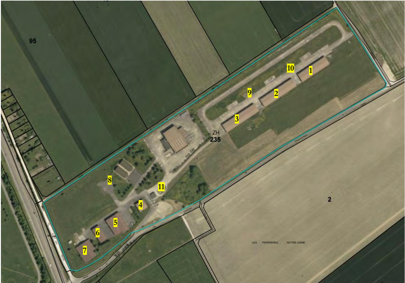
Extrait du plan de masse vue générale PC 02 – A1