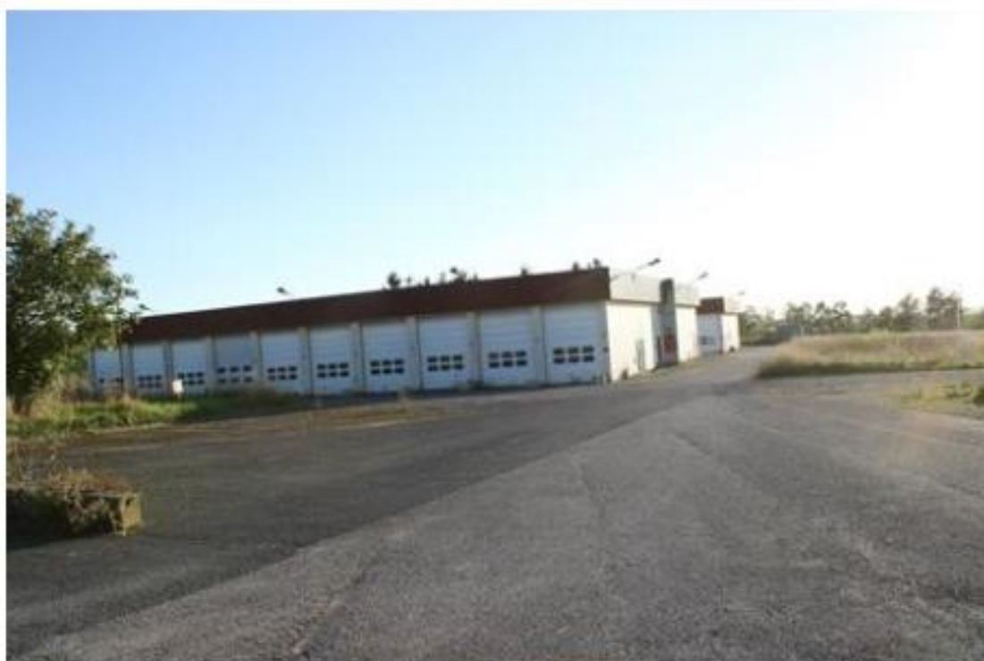
Photographie des garages situés à l'ouest 5, 6 et 7

Des photographies de l'ensemble des bâtiments (intérieur et extérieur) sont présentées dans l'étude d'impact et les études spécialisées (écologiques et paysagères).