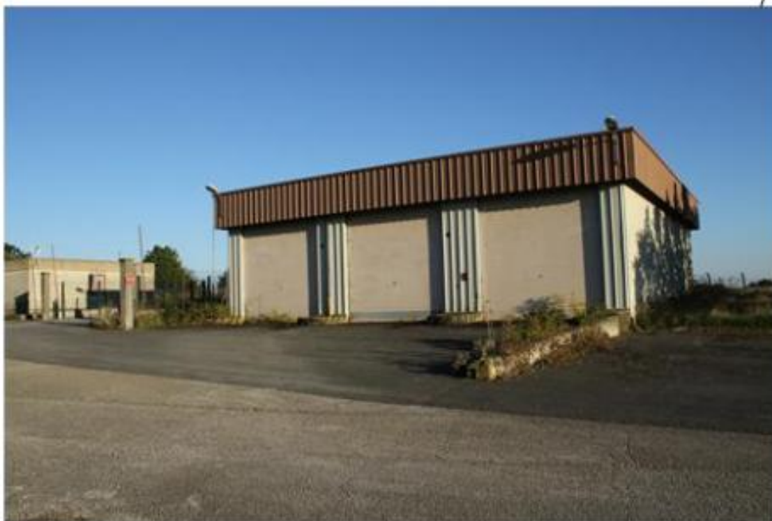
Photographie du garage 4