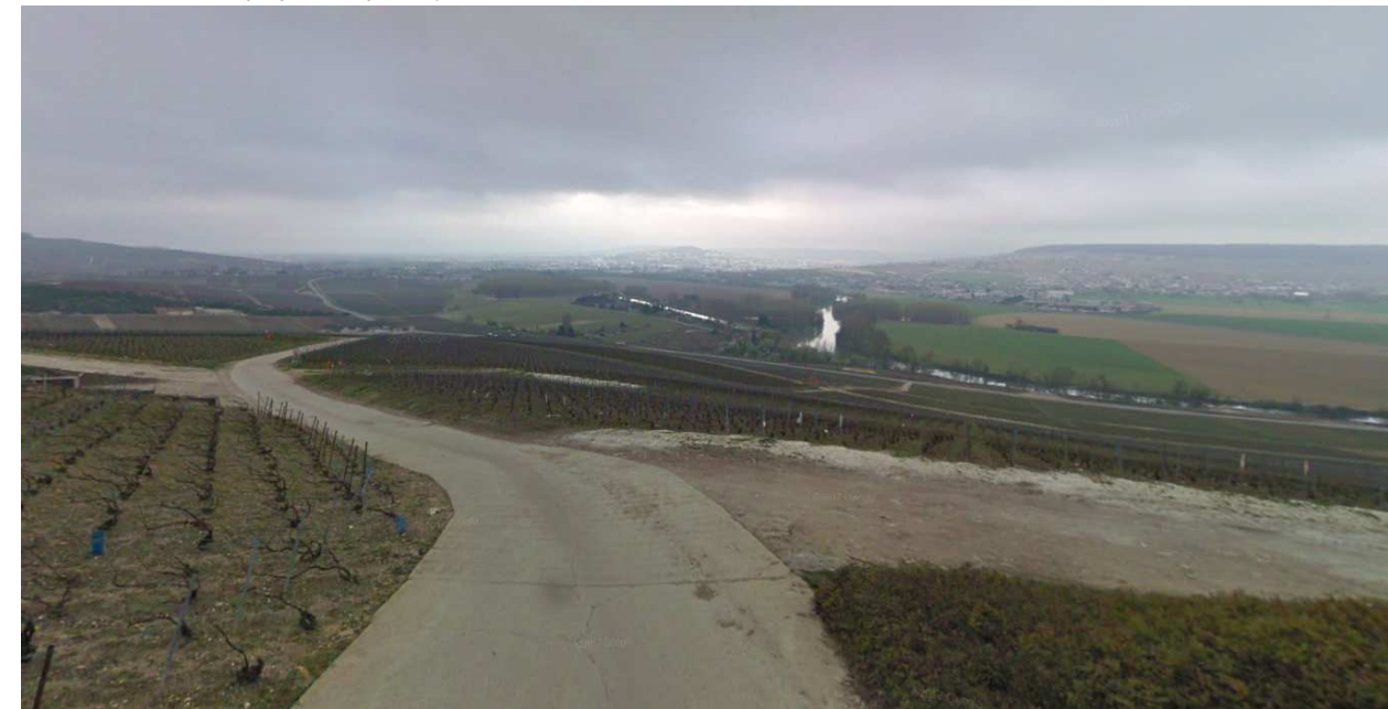
Coteaux historiques au niveau de la commune d'Hautvillers