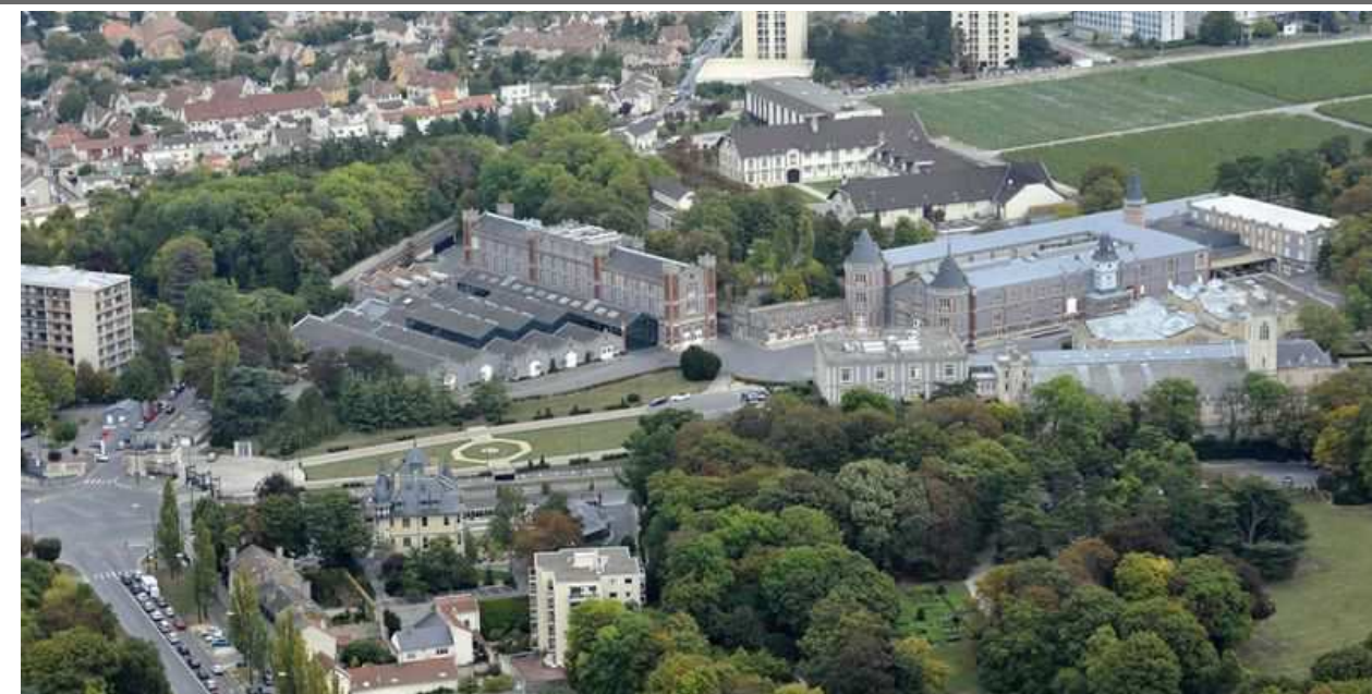
La colline Saint-Nicaise