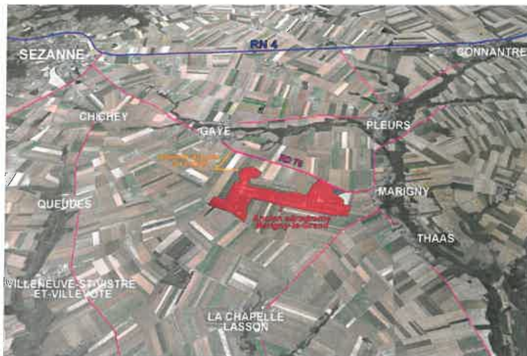
Figure 1 : Localisation du projet

Le projet de permis de construire compte donc 25 860 modules (30%) de moins que celui de l'étude d'impact. L'Autorité environnementale demande de corriger le dossier. 6 à 9 mois d'installation sont prévus pour l'installation de l'ensemble des panneaux.